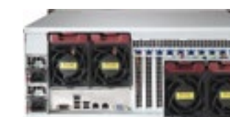
Production à la demande - Serveur - Matériel