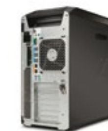
Production à la demande - Station de travail - Matériel